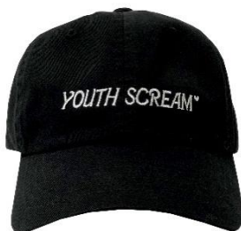
YOUTH SCREAM BLACK CAP 4,500 円(税別)