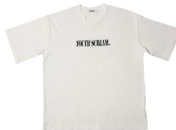
YOUTH SCREAM WHITE T SHIRT 5,800 円(税別)