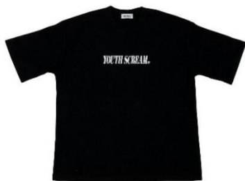
YOUTH SCREAM BLACK T SHIRT 5,800 円(税別)

お互いのブランドの象徴となる youth と scream を組み合わせて 『YOUTH SCREAM』 をコンセプトに作り上げたアイテムです。